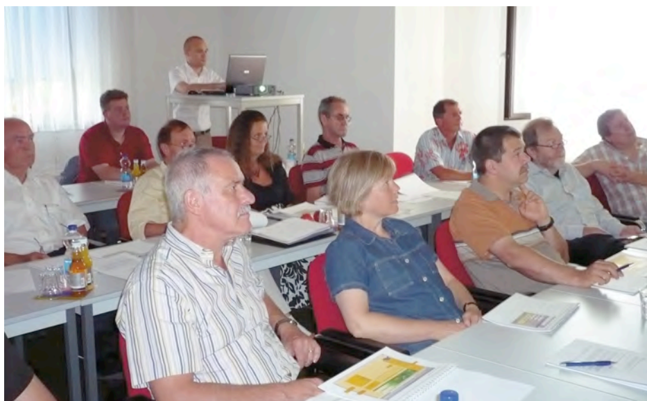
Aufmerksame Zuhörer bei der letzten, voll ausgebuchten Contribute-Schulung